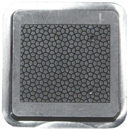
Bild 2+3 | Mit dem Flying Spot Scanner reduzierte sich die Messdauer von 40Min auf 40Sek Verbund-projekt ToolRep (Förderkennzeichen 02P14A032).

Diese Lücke schließt der Flying Spot Scanner (FSS). Der aktive Messkopf wurde spe-zial für den Inline-Einsatz entwickelt und ergänzt sich ideal mit den Chrocodile 2 IT zu einem smarten Inspektionssystem. Über einen Lichtleiter wird das Licht vom Sensor in den Messkopf eingekoppelt und über ein ausgeklügeltes Spiegelsystem umgelenkt. Zuletzt durchläuft das Licht ein telezentrisches Objektiv, das als Fo-kussiermodul auf dem Hinweg und als Messapertur für das reflektierte Licht dient. Durch das bewegliche Spiegelsystem wird der Messlichtstrahl in un-terschiedlichen Winkeln abgelenkt, so dass der Messfleck innerhalb des Blickfeldes des Objektivs frei positioniert werden. Lange Wege von Linearachsen werden durch kurze Drehbewegungen ersetzt, was zu einer deutlichen Verkürzung der Mess-/Scanzeit führt. Durch den Einsatz angepasster Fokussiermodule kann der Scanner für unterschiedliche Anwen-dungsszenarien eingesetzt werden. Die